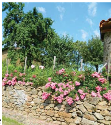
village de la Côte