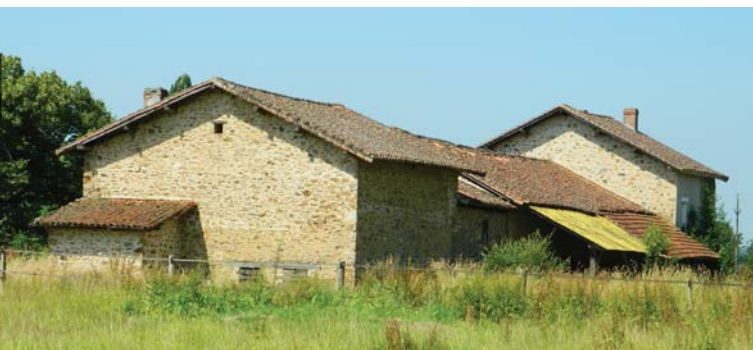
village de Négrelat

Saint-Laurent-sur-Gorre porte le nom d'un des saints les plus vénérés de l'Église romaine : le diacre Laurent martyrisé à Rome en 258. Créée à l'époque mérovingienne, la paroisse a implanté son église près d'un gué sur la Gorre, stratégique depuis la Préhistoire, au croisement de la route du sel, suivie au Moyen-Âge par les pèlerins de Compostelle et de la route des métaux.