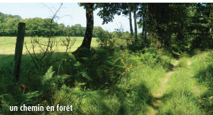
un chemin en forêt

PAYS D'OUEST LIMOUSIN EN CHÂTAIGNERAIE LIMOUSINE